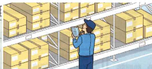
倉庫内の在庫管理