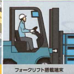
フォークリフト搭載端末