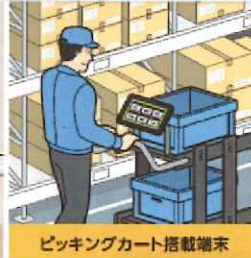
ショッピングカート搭載端末