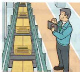
製造品質・工程の管理、監視