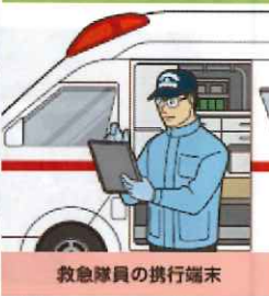
救急隊員の携行端末