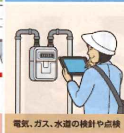
電気、ガス、水道の検針や点検