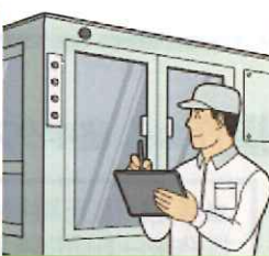
工場検査装置の点検